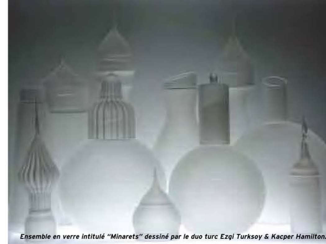
Ensemble en verre intitulé "Minarets" dessiné par le duo turc Ezgi Turksyoy & Kacper Hamilton.