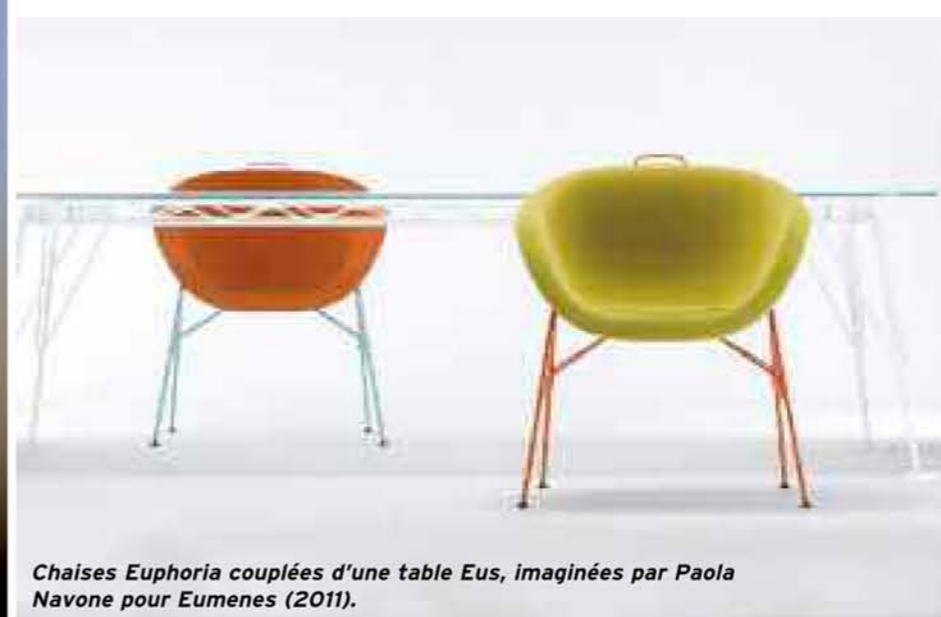
Chaises Euphoria couplées d'une table Eus, imaginées par Paola Navone pour Eumenes (2011).