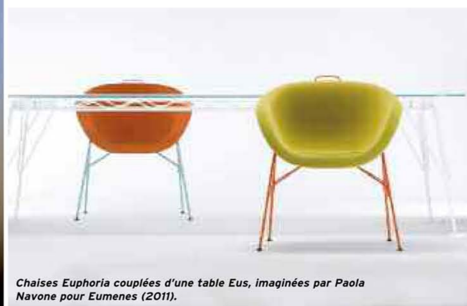
Chaises Euphoria couplées d'une table Eus, imaginées par Paola Navone pour Eumenes (2011).