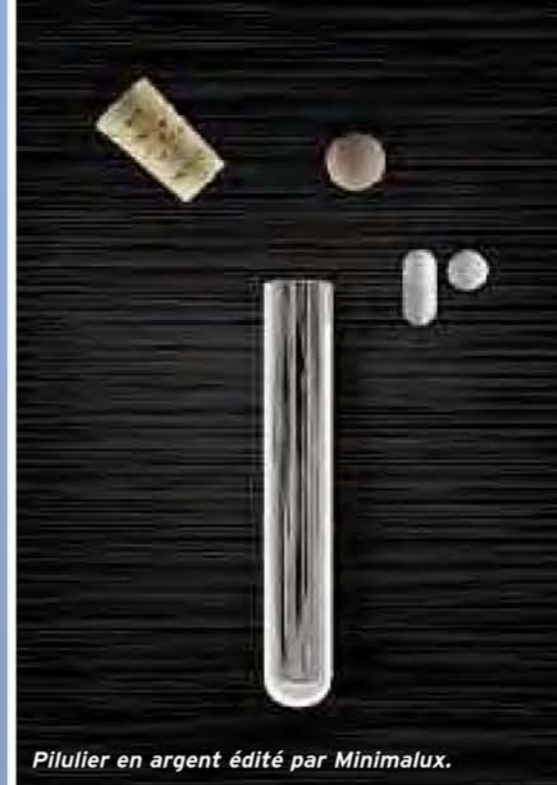
Pilulier en argent édité par Minimalux.